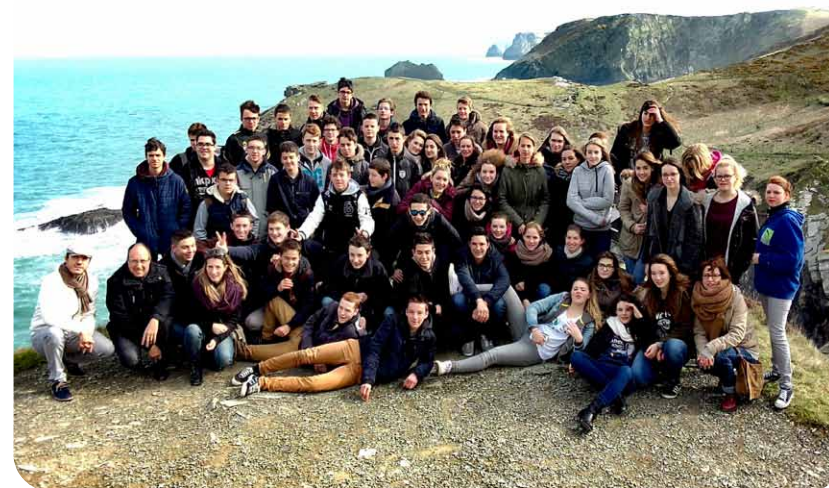
Tintagel castle / Royaume-Uni

Enseignements | Formations | 9 Aux portes du Mans